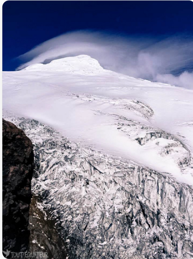
L'imposant glacier du Cayambe